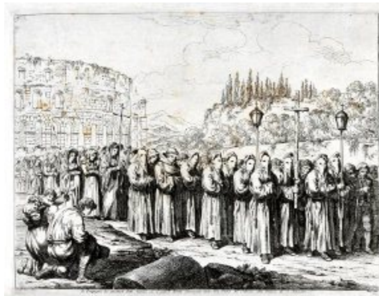
Prozession nach der Kreuzwegandacht im Kolosseum, an der Spitze die Büsserbruderschaft der Sacconi; Kupferstich, Bartolomeo Pinelli, 1820

Als im Geist der Gegenreformation Andachtsformen der Kreuzesmystik besondere Förderung erfuhren, trugen li-