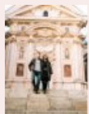
COVERBILD: ERLEBNISREGION GRAZ

Die Erlebnisregion Graz lädt ein, Graz und die Stadtkrone neu zu entdecken: www.regiongraz.at