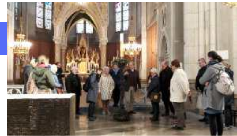
Teilnehmende beim ersten Kennenlern-Nachmittag im Seelsorgeraum im April 2024 in der Herz-Jesu-Kirche

Ziel dieses Projektes ist das nähere Kennenlernen einer Pfarre im Seelsorgeraum, vor allem aber der persönliche