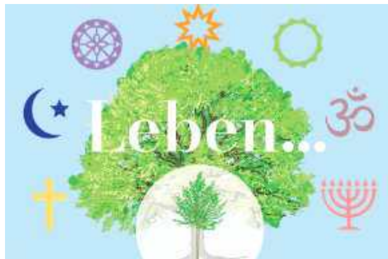
„LEBEN...“ – das Motto des ersten Tags der Religionen in Graz

Mit-Initiator:innen: der Interreligiöse Beirat der Stadt Graz